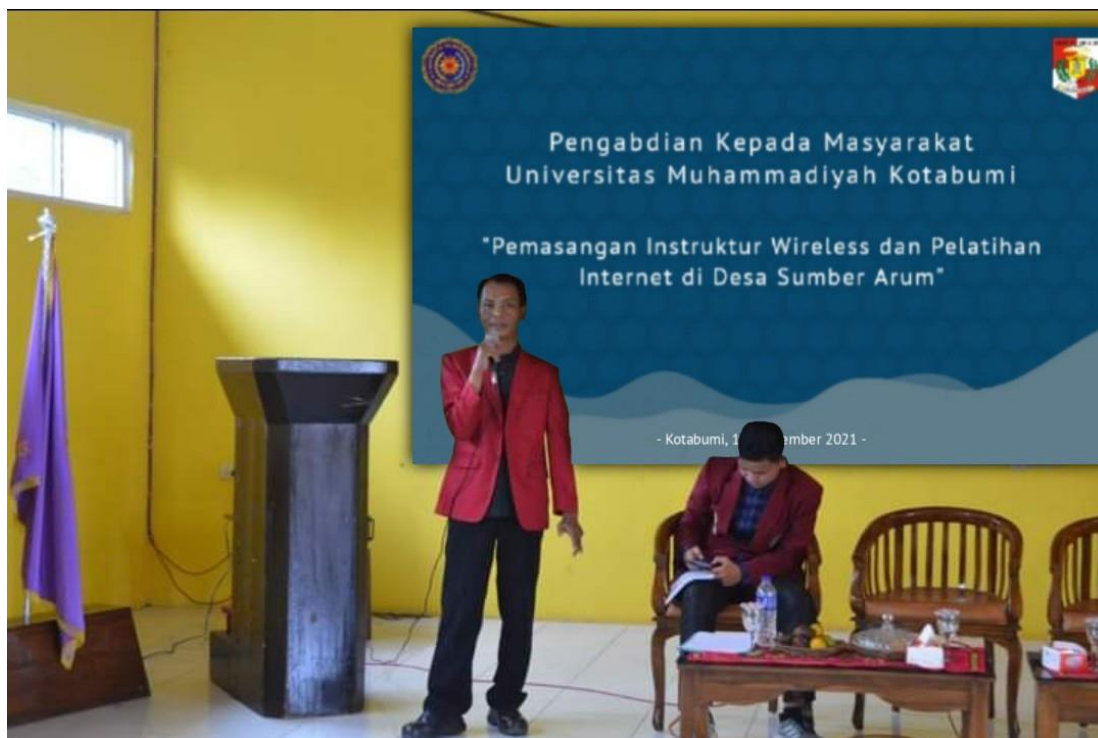
Gambar 2. Penyuluhan dan pelatihan penggunaan internet untuk pembelajaran.

Pada tahap selanjutnya, setelah pemasangan infrastruktur jaringana internet terlaksana, dilakukan pelatihan pemanfaatan akses internet untuk pembelajaran daring. Dimulai dengan memberikan penyuluhan dengan materi pengetahuan-pengetahuan dasar dalam penggunaan internet untuk pemelajaran daring. Masyarakat sasaran diberikan pengetahuan tentang istilah-istilah yang berkaitan dengan teknis pembelajaran daring.