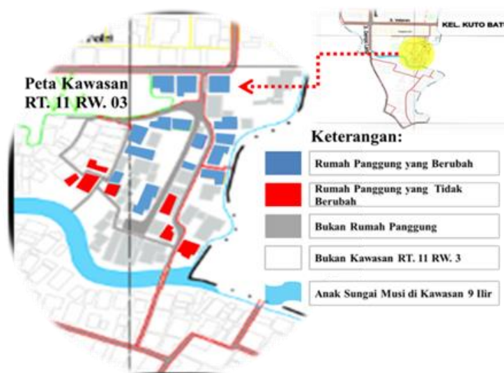
Gambar 1. Lokasi Objek pengamatan

Guna menguji teori adaptasi material hunian, penelitian ini akan melakukan studi kasus pada sebuah kawasan permukiman di Kota Palembang yang banyak memiliki rumah panggung yang telah berusia tua. Lokasi studi terpilih adalah permukiman pada RT 11 RW 03 Kelurahan 9 Ilir Kecamatan Seberang Ilir II. Hunian panggung di kawasan ini cukup banyak dan memiliki banyak variasi sehingga dapat digunakan sebagai sampel penelitian. Letak lokasi terlihat pada gambar 1.