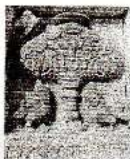
Koleksi: Muhamad Idris