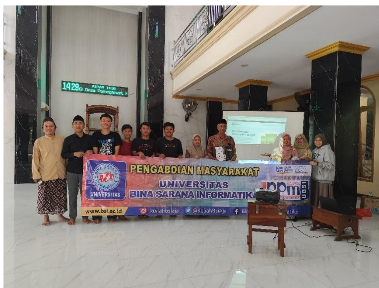
Gambar 13. Foto Bersama antara tim tutor dengan DKM