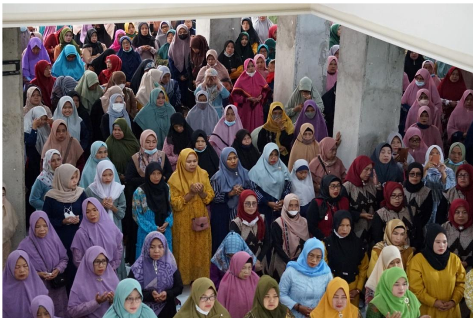
Gambar 2. Pengajian Rutin Masjid Jamie Nurul Huda