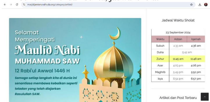
Gambar 7. Tampilan halaman Artikel

Halaman ini berisi artikel dan berita, jadwal sholat