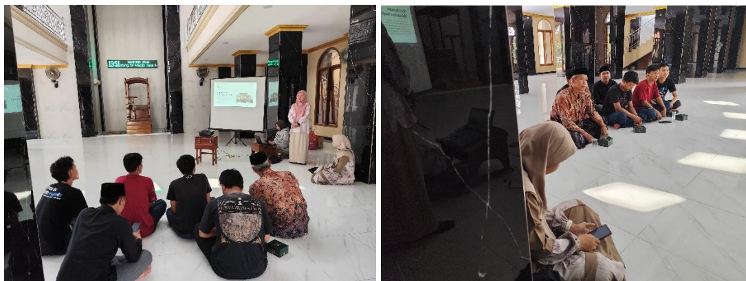
Gambar 11. Pemaparan materi mengenai pengenalan sistem informasi DKM oleh tutor