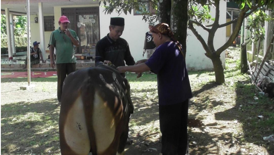
Gambar 3. Kegiatan Qurban Pda Masjid Jamie Nurul Huda