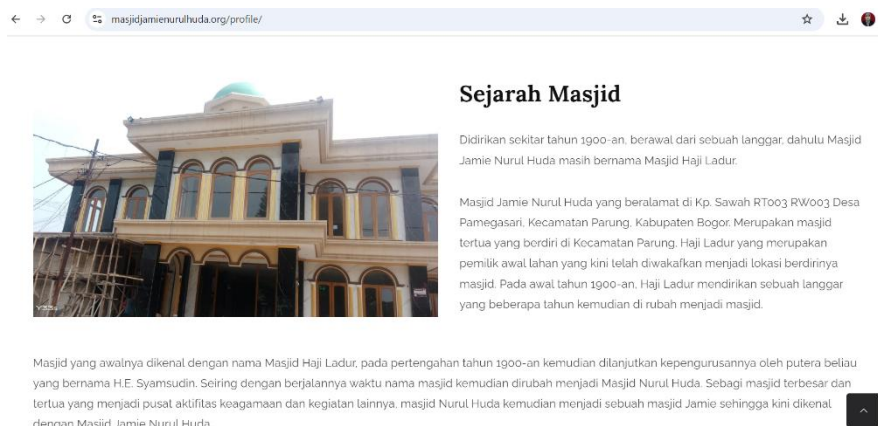
Gambar 6. Tampilan halaman Profile

Berisi mengenai informasi sejarah masjid Jamie Nurul Huda, Visi dan Misi, Susunan Pengurus DKM.