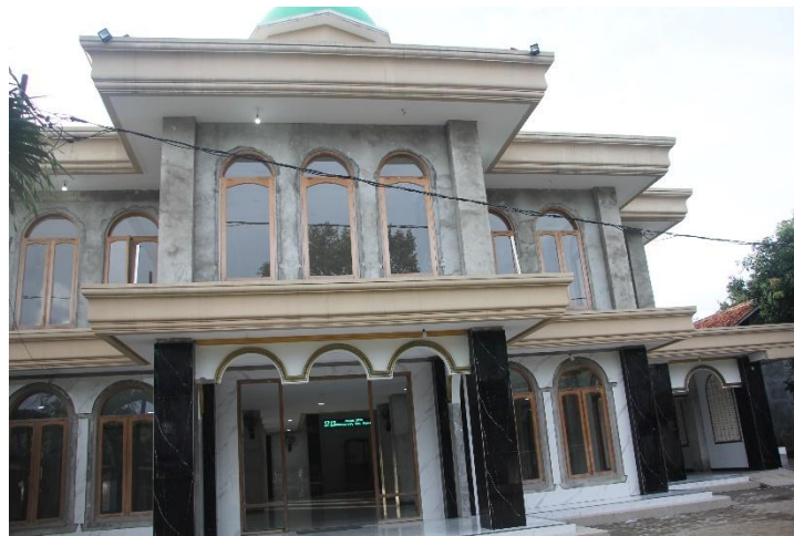
Gambar 1. Masjid Jamie Nurul Huda

Bahan yang dibutuhkan meliputi modul pelatihan dan panduan penggunaan SIMAS, database masjid yang berisi data jamaah dan kegiatan masjid, serta alat tulis seperti buku catatan dan pena untuk pencatatan manual. Formulir data masjid juga disiapkan untuk pengumpulan data yang belum tersusun secara elektronik. Semua alat dan bahan ini berperan penting dalam mendukung keberhasilan implementasi sistem informasi di masjid tersebut.