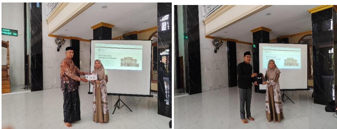
Gambar 12. Penyerahan cinderamata kepada ketua DKM