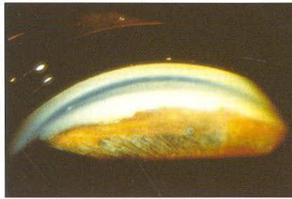
Gambar 4. PAS pada ICE syndrome. 1