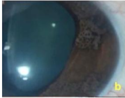
Gambar 3. Nodul iris pada Cogan-Reese syndrome . 5