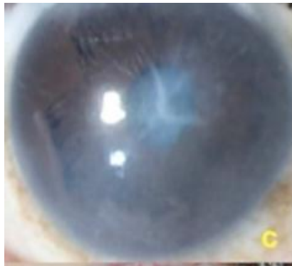
Gambar 2. Edem kornea dan endothelial dystrophy pada Chandler syndrome . 5

dan sering di diagnosa lebih awal karena terdapat edem kornea. 1 Iris atrofi kurang menonjol pada Chandler's syndrome , terdapat corectopia dan bila iris atrofi terdeteksi sering terbatas pada stroma iris anterior. Pupil biasanya bulat atau sedikit oval. 3,5